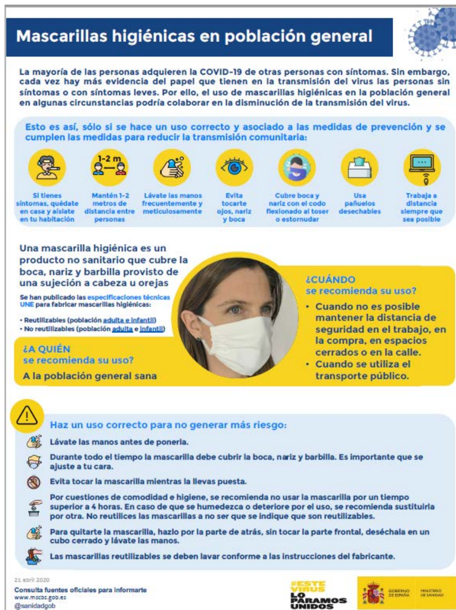
Mascarillas higiénicas en población general (Ministerio de Sanidad, Consumo y Bienestar Social, 2020)

Nota: las mascarillas quirúrgicas y las mascarillas higiénicas no son consideradas EPI.